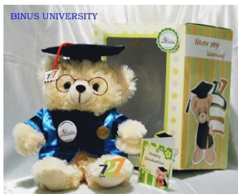
a. Hasil googling

Apakah mereka Lebah (Gambar 1) dari Keluarga yang sama? Apakah mereka merepresentasikan nilai-nilai yang sama. Ancaman terhadap eksistensi dan aktualisasi maskot BEE adalah hilangnya identitas BINUSIAN yang seharusnya melekat representasi FISIK dan SIFAT BINUSIAN.