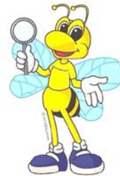
c. Koji – Lebah Pajak d.