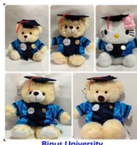
b. Varian jualan maskot