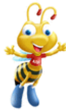
b. Albi – Alfamart