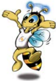
a. BEE – BINUS University