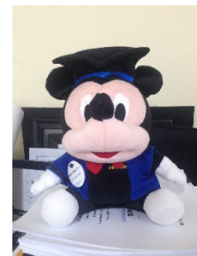
c. Hasil maskot terakhir yang ada di Fakultas Teknik